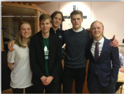
Nýkjörin stjórn KSS

Aðalfundur KSS og KSF og ársþing KSH var haldið 21. apríl síðastliðinn þar sem nýjar stjórnir félaganna voru kosnar. Við bjóðum nýjar stjórnir velkomnar til starfa og þökkum jafnframt fráfarandi stjórnnum fyrir þeirra störf.