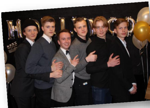
Myndir frá árshátíð KSS 2018