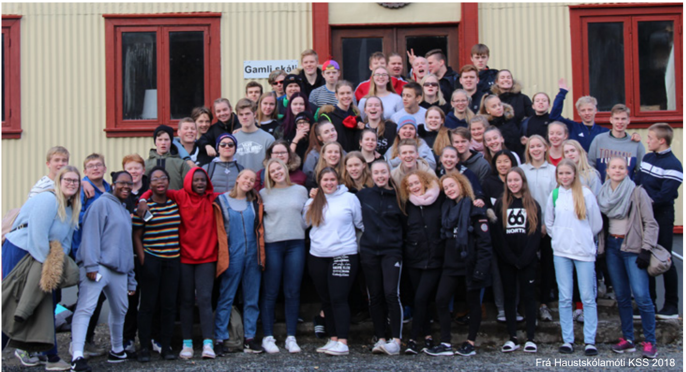
Frá Haustskólamóti KSS 2018