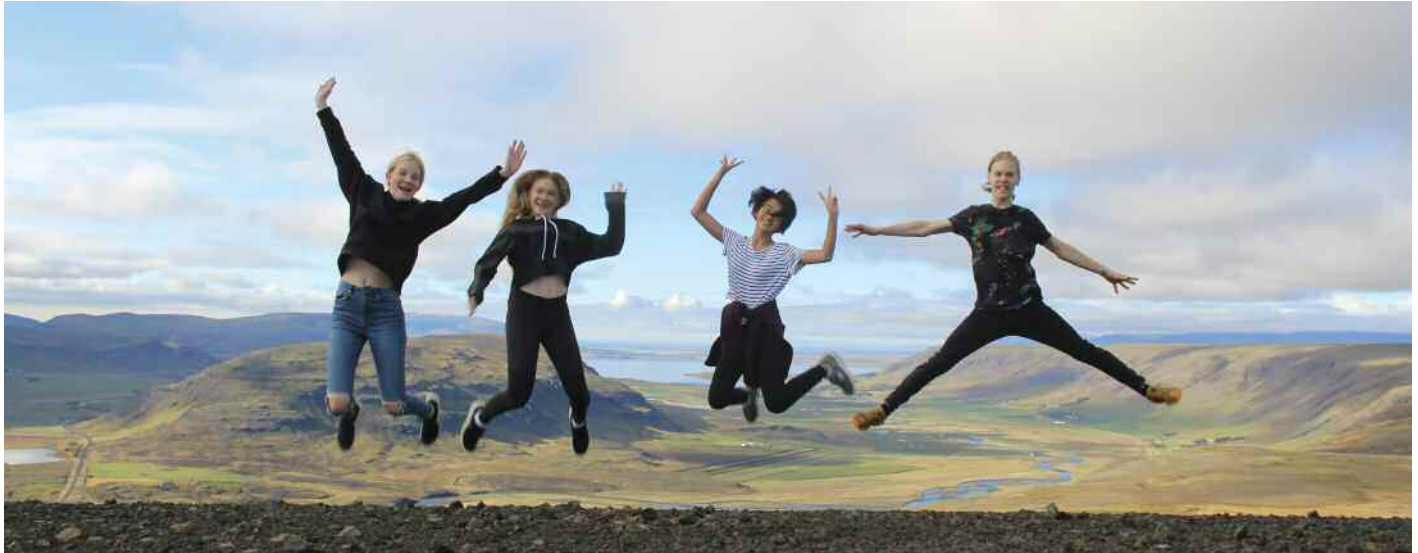
KSS-ingar á Sandfelli á haustskólamáti 2017