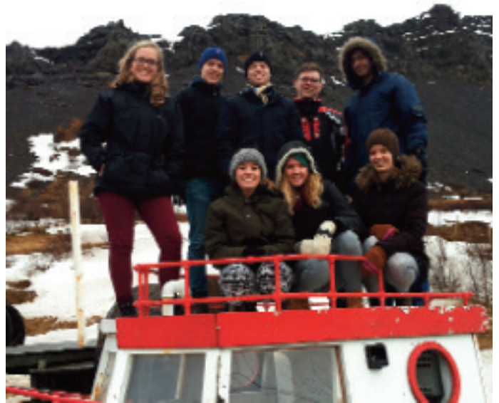
Stúdentamót KSF var haldið í Ölveri í janúar 2014.

Reikningur KSH: 117 – 26 – 119105 og kennitala 510479-0259 .